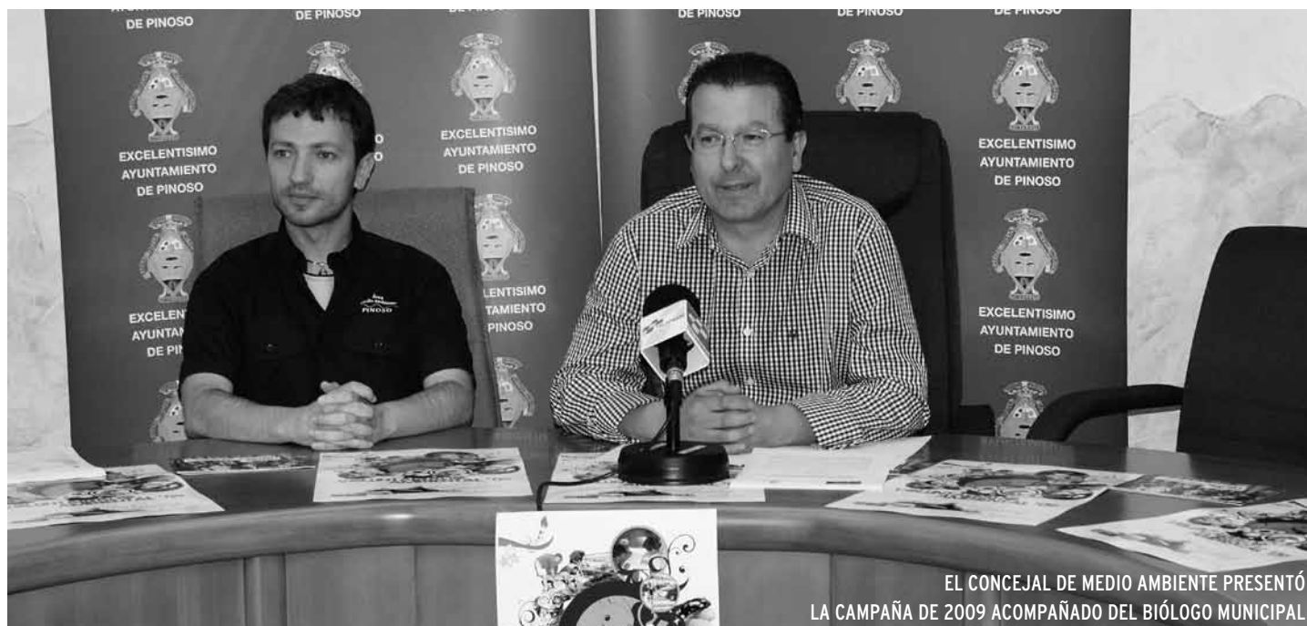
EL CONCEJAL DE MEDIO AMBIENTE PRESENTÓ LA CAMPAÑA DE 2009 ACOMPAÑADO DEL BIÓLOGO MUNICIPAL