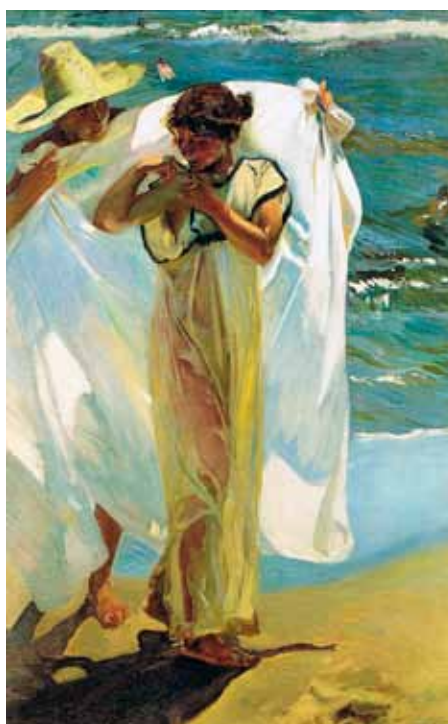
SALIENDO DEL BAÑO (1908)

Society of America de Nueva York. Tarea que le ocuparía 8 años recorriendo nuestra piel de toro entre penurias y soledades. Cada día escribía a su esposa, adjuntando una rosa de amor a las letras. El panel de Castilla, con la espectacular "Fiesta del Pan", nos da la bienvenida al arribar a la planta segunda de la exposición. En la primera, sobrecoge la "triste herencia!", con la que obtuvo el Grand Prix en la Exposición Universal de París (1900) y la gloria. A los 30 años tenía calle en Valencia. Elogiaron sus pinturas, retratos y autorretratos (uno aparece aquí), Blasco Ibáñez y Pérez de Ayala.