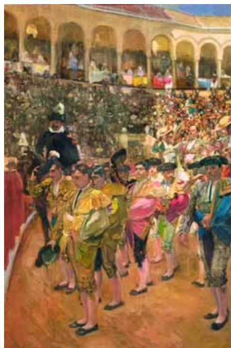
LOS TOREROS (1915)

Si los visitantes a esta exposición quieren conocer más al pintor, pueden acercarse al Museo que lleva su nombre, en el Paseo General Martínez Campos, 37, la que fuera su casa en la capital de España. Se inauguró en 1932, y desde 1973 es Museo estatal dependiente del Ministerio de Cultura. Su jardín es reflejo del alma de Sorolla.